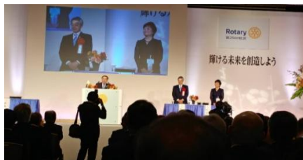
秋川ロータリーの皆様

会員の減少を感じ、各クラブのサポートをしていこうと思っている。 国際ロータリーの進む方向性を考え、青少年の活動を応援していくことは、大切なことだと思う。 例会出席も大切なことで、女性会員を増やすことに力を入れたい。