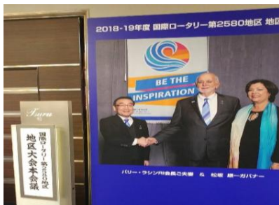
国際ロータリー会長代理夫妻 松宮 剛 様