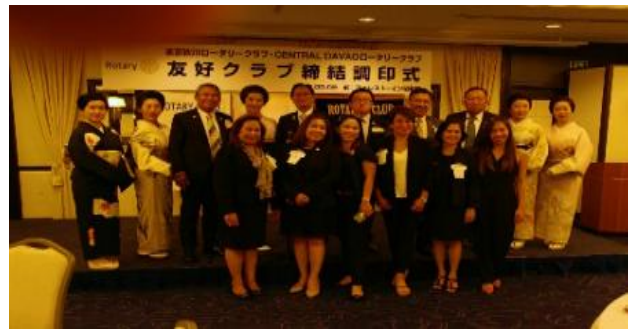
セントラルダバオRCの皆様