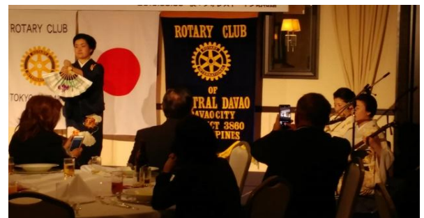
八王子芸者さんによる余興