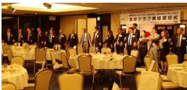
手に手をつないで