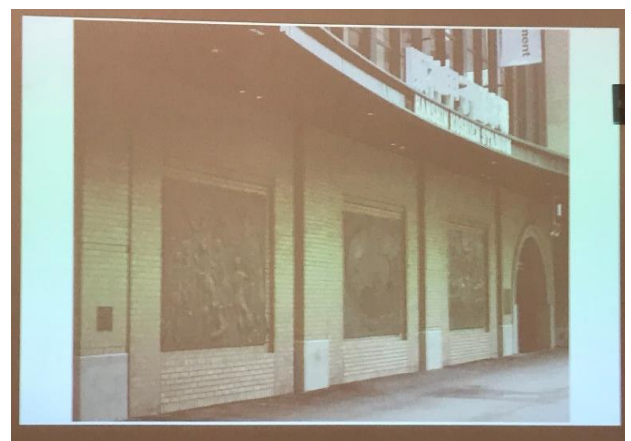
(甲子園球場正面のレリーフ)